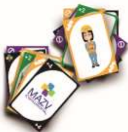
La última tarjeta SHE

Tú eliges el tema y nosotros hacemos el diseño, el cual puede ser personalizado con el logo de tu empresa.