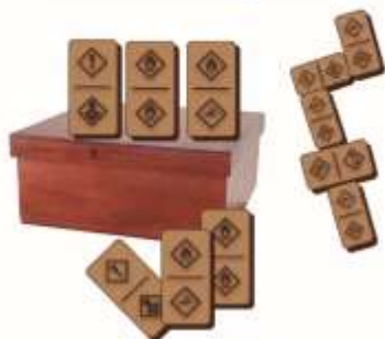
Juego didáctico Dominó GHS