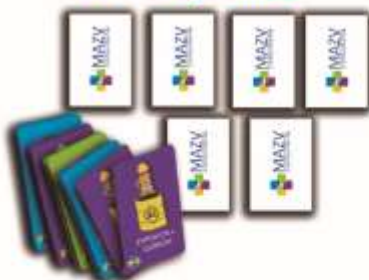
Busca tu Par