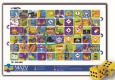
Serpientes y escaleras de la seguridad.