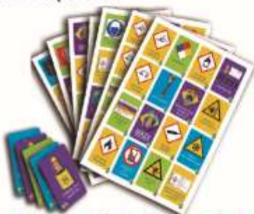
Lotería de la Seguridad