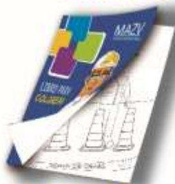
Libro para colorear